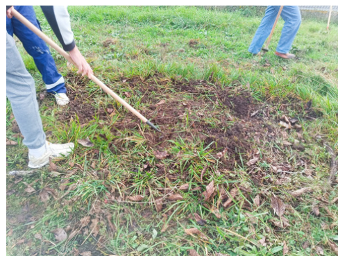
Mise en hivernage du potager

Le 6 mars, ils ont semé des tomates boulettes de Touraine, des épinards et des potirons avant de déposer les semis au CDI du site Prébendes. Chaque jour, selon un planning bien défini, les élèves viennent les arroser. Lorsque les plantes auront poussé, les élèves les replanteront dans des petits pots afin qu'elles terminent leur croissance avant de rejoindre le potager.