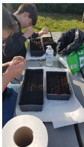
Réalisation des semis