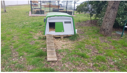
Modèle de poulailler installé au collège