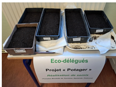
Pousse des semis au CDI